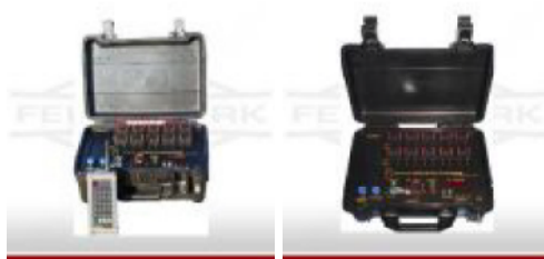
20 / 40 / 60 Kanäle